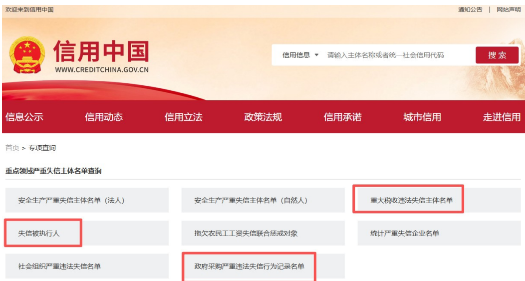
截图示例 1：失信被执行人（注意省份不要选择，查询的结果即为全国范围）

查询方式: 进入信用中国首页→专项查询。分别点击“失信被执行人、重大税收违法案件当事人名单、政府采购严重违法失信行为记录名单”在输入框中输入 供应商名称 进行查询后截图，并加盖公章。